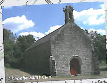
Chapelle Saint Clair