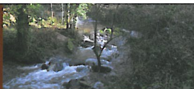
Ruisseau de Trévelo