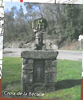
Croix de la Bécane

B de 6 km). 3 sinon (boucle C de 8 km), prendre à droite, descendre à la rivière, franchir la passerelle et remonter à gauche sur Béganne (jonction avec les circuits de Béganne) • le sentier revient à gauche vers le pont • suivre le chemin dans la vallée pour un détour vers chapelle de Bourg Maria à 300 m. 4 reprendre le chemin herbu qui contourne le vallon • prendre la