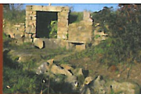
La fontaine du Cota